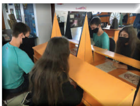
музею - довести, що наука може бути захоплюючою та з елементами шоу.

З інтерактивними експонатами музею студенти Вінницького фінансово-економічного університету спостерігали зародження торнадо, створювали блискавку, змушували літати магніт і навіть зазірати у нескінченність. Тільки простягни руку, щоб ввімкнути, повернути, розкрутити, натиснути, потягнути, штовхнути, і ти на власні очі побачиш, як працює фізичний закон.