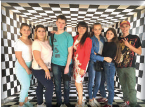
Музей науки доводить, що наукові дослідження - це надзвичайно цікаво та пізнавально! Усі експерименти безпечні. Мета організаторів